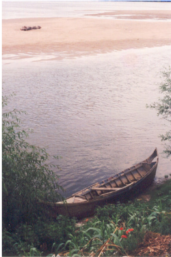
Barco e mochão