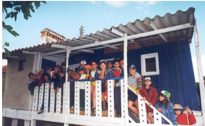
Aula de Ambiente