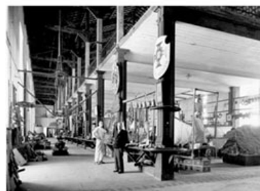
O Museu de Marinha na antiga Escola Naval

O seu património tem vindo a ser enriquecido, ao longo dos anos, com modelos construídos nas suas próprias oficinas e com muitas peças adquiridas no exterior e outras doadas por amigos do Museu.