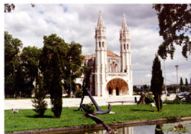
A entrada do Museu de Marinha no Mosteiro dos Jerónimos