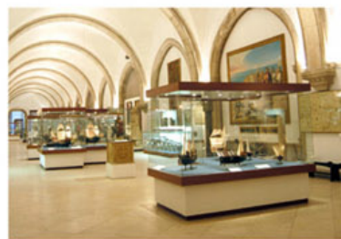
O Museu de Marinha hoje - Sala dos Descobrimentos